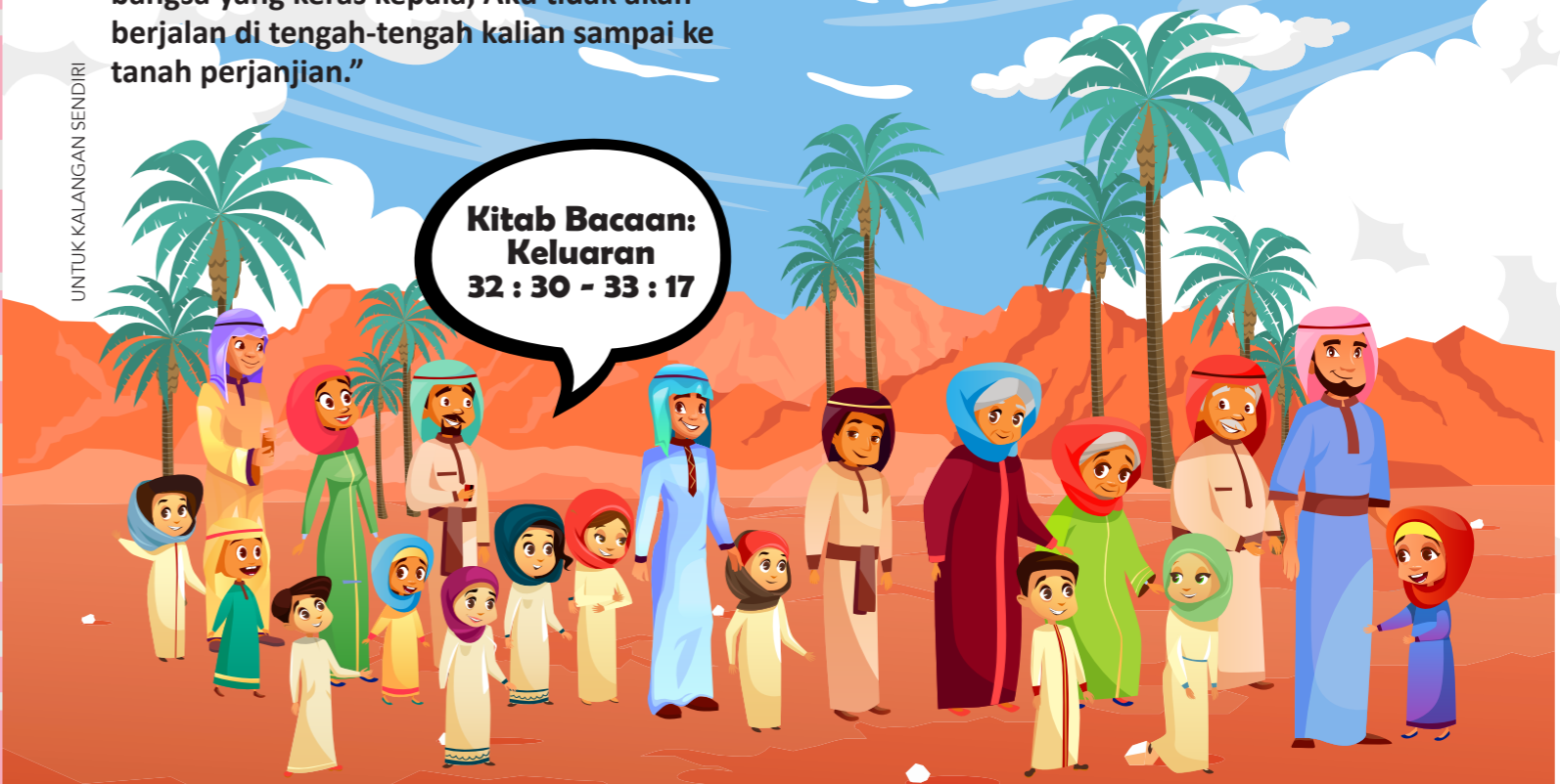
UNTUK KALANGAN SENDIRI

Kitab Bacaan: Keluaran 32 : 30 - 33 : 17